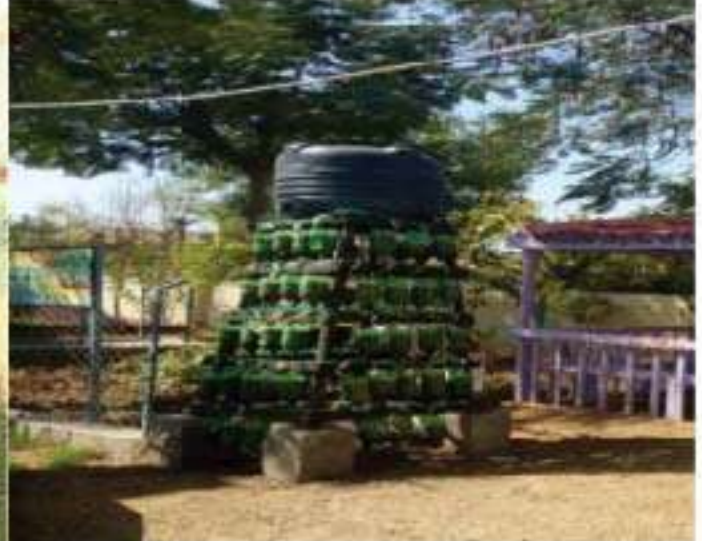
ગુજરાતની શાળાઓમાં ટપક સિંચાઈ