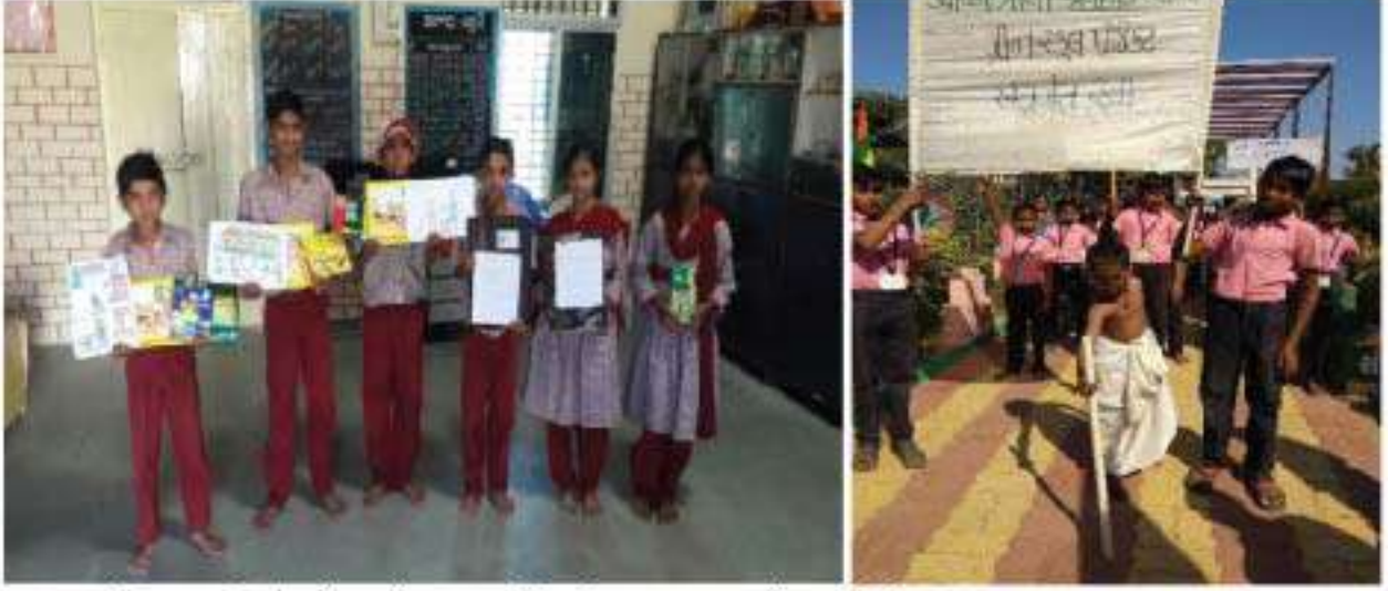
ગુજરાતની શાળાઓમાં હરિયાળી શાળાઓને પ્રોત્સાહન આપતી પ્રવૃત્તિઓ