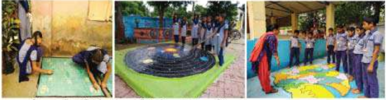
ગુજરાતની શાળાઓમાં બિલ્ડિંગ એઝ લર્નિંગ એઇડનાં ઉદાહરણો