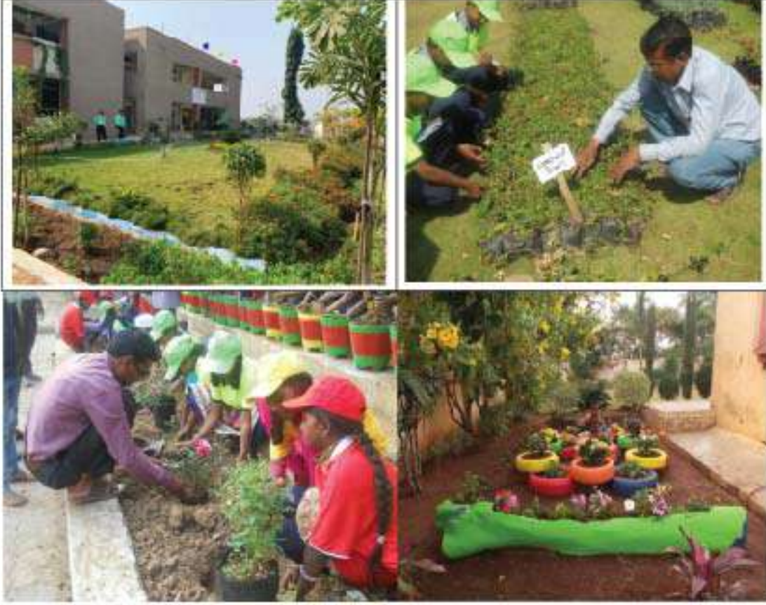
શાળાઓમાં વૃક્ષારોપણની પ્રવૃત્તિઓ