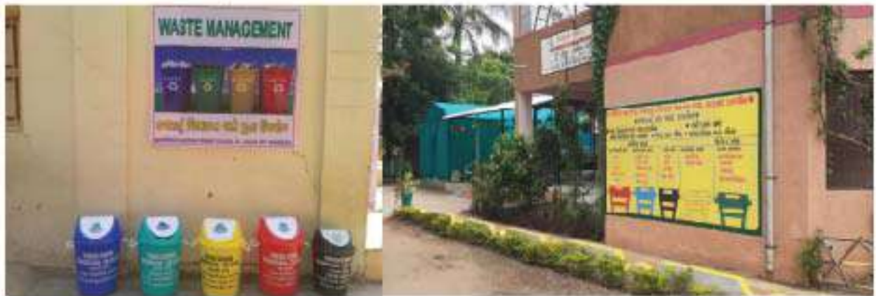
શાળાઓમાં રંગબેરંગી કચરાપેટીઓ