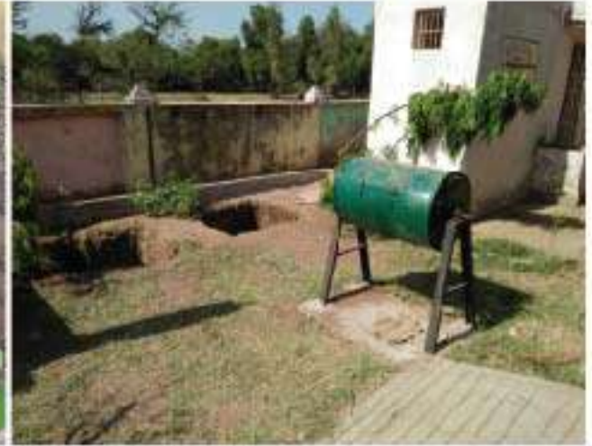
શાળાઓમાં ખાતર/વર્મીકમ્પોસ્ટિંગ પ્રવૃત્તિઓ