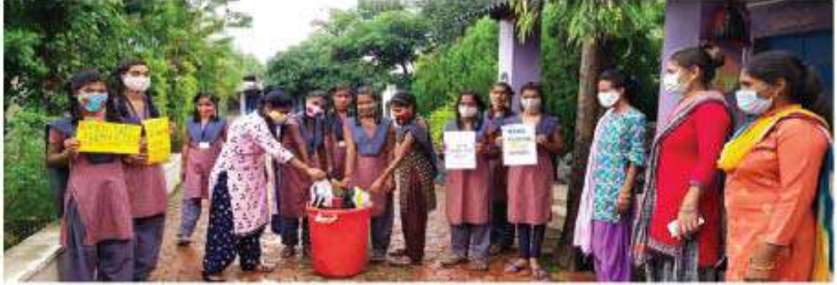
સ્વચ્છતા પંચવાડા માટે સૂચવેલ કાર્ય યોજના