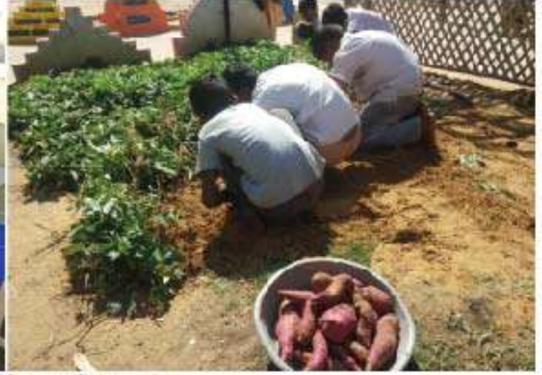
ગુજરાતની શાળાઓમાં શાકભાજી/ઔષધી બાગ/કિચન ગાર્ડન